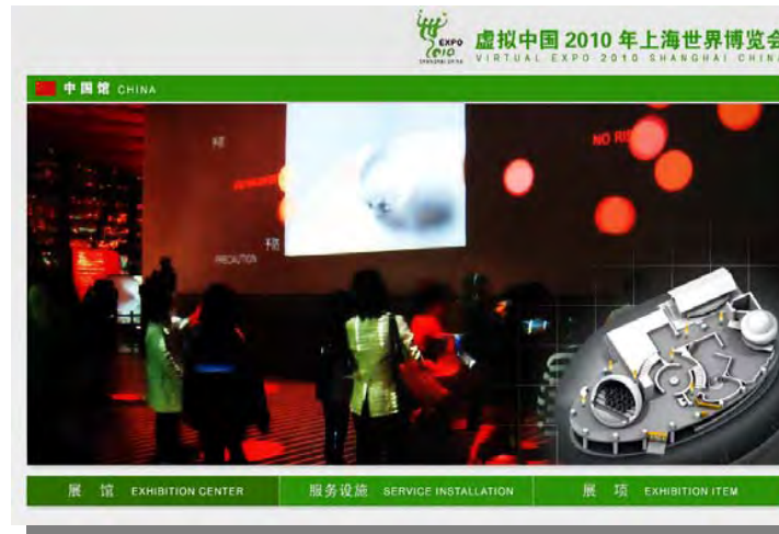
バーチャルパビリオンの建設

万博オンラインは、2つのネットワーク・プラットフォーム、サイト及びパビリオンからなる。参加者は、そのパビリオン・オンラインを自由に設計できるが、開催者は、サイトのプラットフォームの設計に責任をもつ。