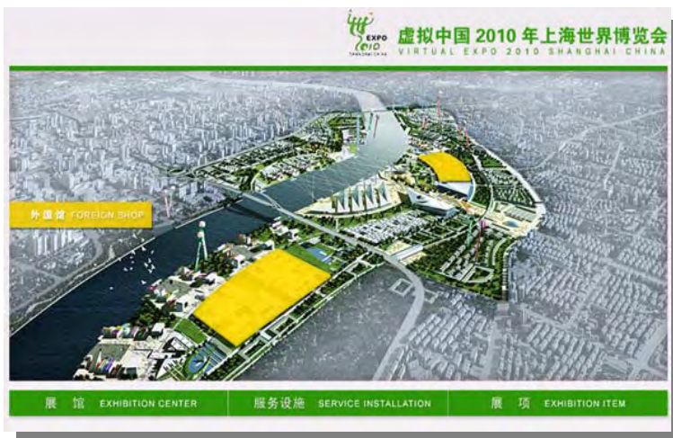
万博オンラインの建設